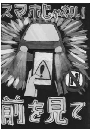
足立陽香さんの作品