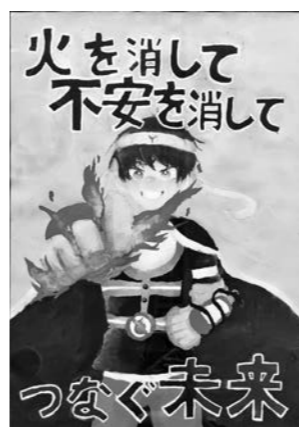
清水華保さんの作品