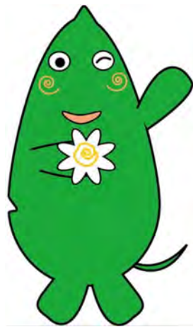
大和市イベントキャラクター「ヤマトン」