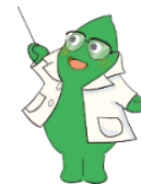
大和市イベントキャラクター ヤマトン

大和市では、いわゆる「ひきこもり」のかたがたに寄り添いたいとの思いから、より温かみのある「こもりびと」という呼称を使っています。