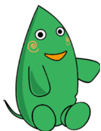
大和市イベントキャラクター 「ヤマトン」