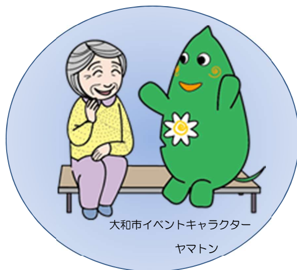
大和市イベントキャラクター ヤマトン