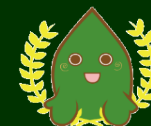
Illustration Design: 荒川広美氏 (第1回YAMATOイラストレーションデザインコンペ最優秀賞受賞者)