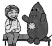
大和市イベントキャラクターヤマト