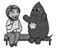
大和市イベントキャラクターヤマトン

境川通りにトイレが無く、横浜市(本郷公園)のトイレお借りしているので、散歩コースにトイレがほしいです。