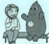
大和市イベントキャラクターヤマト