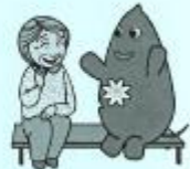
大和町イベントキャラクターヤマトン