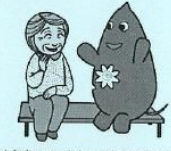
大和市イベントキャラクターヤマトン

大和で長年、理容店を営んでいます。 今は任せているので、自分の判断で はまめをもつことはやめましたか。 裏方にまわり洗濯など 手伝っています。これからも 続けて健康に生活してい たいです。