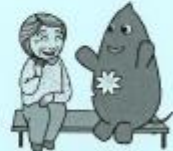
大和市イベントキャラクターヤマト