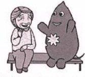
大和市イベントキャラクターヤマトン

もの忘れをみるおにやじと 娘が帰って来てくれたらな。 仏様がいのち 家を守りたい。