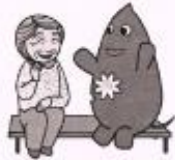
大和市イベントキャラクターヤマトン