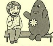
大和市イベントキャラクターヤマト

制約をしないで（或は程度の自由・自主 という事か来るように、（○○してはいいから でしほらぬ）、該当者が居ても 家や自治体 が同様に遠慮し過ぎて、 困りか助け合う零の手作り 隣近所と助け合いがてき