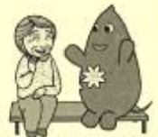
大和市イベントキャラクターヤマトン