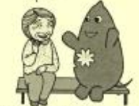
大和市イベントキャラクターヤマト

・東急へは12時頃行くと言っていたので、その頃に行くとす。 ・20分たいてお帰りの時間には出てきて。 ・(皆大に)喜んでいいます。 ・望む暮らしは、今のままです。 本人の話しに付いてお話をきいて 得ることも多いです。 「今のまま」をふたつおわりから推測すると、 「家族(旦那様)や血縁の親類を周りに つたわい)を保護している暮らし」 に望んでいいると推測できます