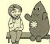
大和市イベントキャラクターヤマトン

人の役に立つ事をやりたい。 やらせて欲しいか、周りが やらせてくれるのか さみしい。