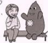
大和市イベントキャラクターヤマト

頭を使う事、脳トレを続けたい。 昔の事を思い出すから私にとっては最高。 テレビはあまり観たいとは思わない。 テレビの中でも、地方にあるところ 行くよう「のは自分が行けない から観たい。やりたい事は 昔にやりつくしました。