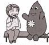
大和市イベントキャラクターヤマトン