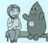
大和市イベントキャラクターヤマトン