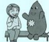
大和市イベントキャラクターヤマトン