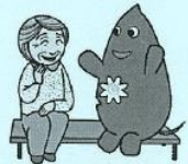
大和市イベントキャラクターヤマトン