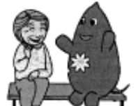
大和町イベントキャラクターヤマトン

穏やかで静かな街。 音楽、特に演歌が好き。音楽を聴けるスペースが あったらいいと思う。