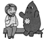
大和市イベントキャラクターヤマト