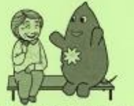
大和市イベントキャラクターヤマトン

昼間は家に誰もいない。その間デイサービス に来られるから、このままでいい。 ご飯は嫁が作ってくれる。できたら呼んでくれ るから、家にいる時も、このままで いい。