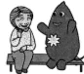
大和市イベントキャラクターヤマト

認知症の家族からお話をきい居る中で連絡をします 自分もこのように何した時にお話をします とで外出で戻った時に声をかけることです 誰にもあることですから要諦をばはうね