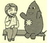
大和市イベントキャラクターヤマトン

皆さんどサークルをしたいなと思う デンスービスをこうやって続けたいな と思っます。 この処忘れがひどい ボケがひどいので大変です