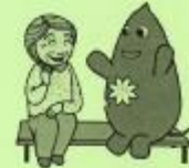
大和市イベントキャラクターヤマト