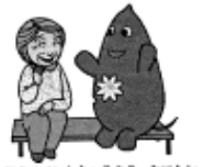
大和市イベントキャラクターヤマト