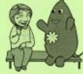
大和町イベントキャラクターヤマトン

新型コロナウイルスに焦らず対応して これまでの日常に戻って、お茶の会に 参加したい。