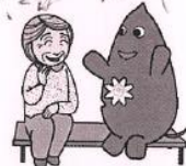
大和市イベントキャラクターヤマトン

私はみなさんと明るくお話し して笑って元気で行きたいです 家で暮らしているとさびしく、喜んで お話しお話を聞くと明るく 元気になります