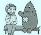
大和市イベントキャラクターヤマト