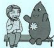
大和町イベントキャラクターヤマトン

遠くの病院に行かなくても、近くの病院に 認知症に理解・知識のある医師が増えると いいと思う。