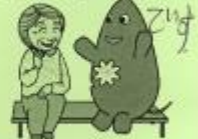
大和町イベントキャラクターヤマトン

・エナジートロンバネアスフロカを設置してもらいた いです。 ・身体の悪い人に住みやすい環境にしてほし いです。 ・要支援1の人にもっと援助を出してもらいた いです。 ・タキシードの着付けがほしいです。