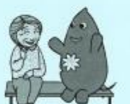
大和市イベントキャラクターヤマト