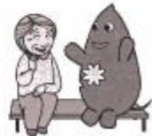
大和町イベントキャラクターヤマトン

大和は住みやすい所。みんな優しい。 何かあったら良いか？とは考えてほしい。不便はこぼ 考えてほしい。歩いて5分ぐらいの所に公園があって 息子と一緒に行く。息子は本当に優しい子。 ありのままに生活している。