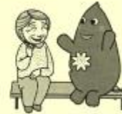
大和市イベントキャラクターヤマトン