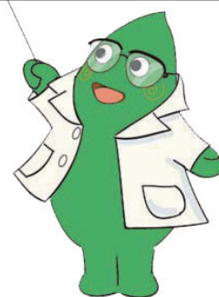
大和市イベントキャラクター ヤマトン