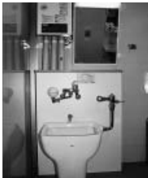
市役所に設置されたオストメイト対応トイレ

オストメイト…直腸やぼうこうなどのがんを切除したため、腹部にストーマという排せつ口を開け、人工肛門、人工ぼうこうを使用している人。