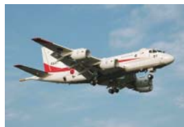
次期固定翼哨戒機(XP-1)1号機

海上自衛隊次期固定翼哨戒機(XP-1)の1号機が昨年9月5日、性能評価のため厚木基地に飛来しました。その後、2号機が11月6日に飛来し、現在2機のXP-1が性能評価を実施しています。