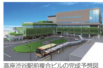
高座渋谷駅前複合ビルの完成予想図

市は、日本土地建物株式会社グループと協定を結び、(仮称)高座渋谷駅前複合ビルの建設を進めています。来年1月に完成予定の同ビルには市南部の防犯活動の拠点として、大和市初となる(仮称)市営交番を新設します。また、渋谷学習センターと渋谷分室が移転するほか、スーパーや銀行、温浴施設などの民間施設がテナントとして入居する予定です。