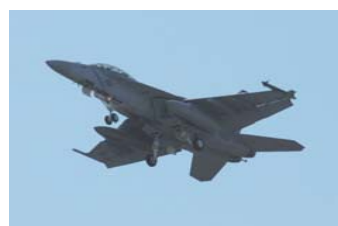
厚木基地に飛来する空母艦載機 F/A-18Fスーパーホーネット