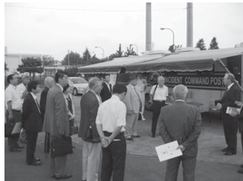
災害対策関連設備などの説明を受ける委員ら

同協議会では今後も、市民、議会、行政が一体となり、厚木基地の状況についてさまざまな角度からの把握に努めるとともに、厚木基地にかかわる問題の解決に向けて取り組んでいきます。