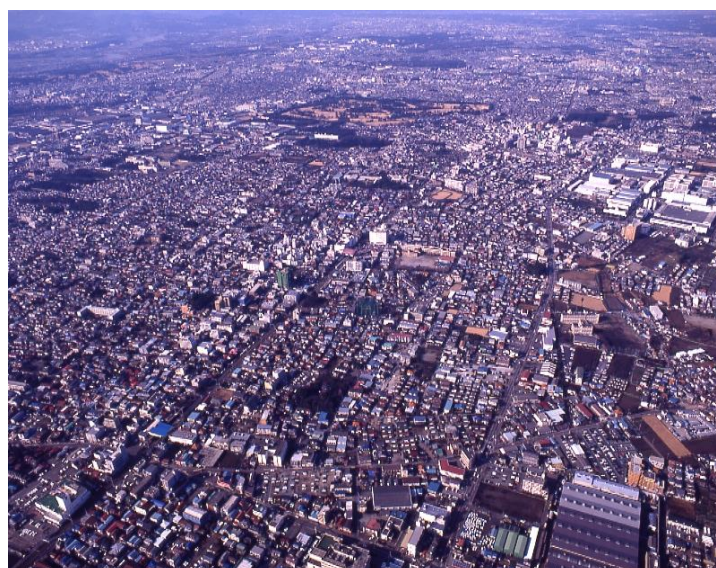
住宅が密集する大和市域北部