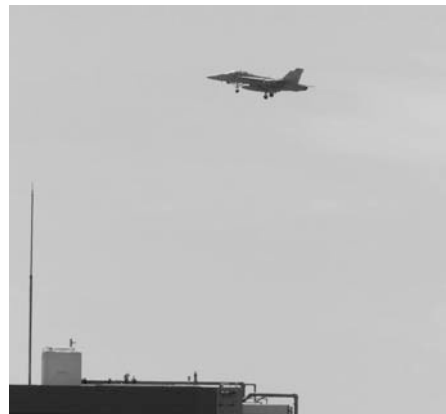
移駐後も厚木基地に飛来するジェット戦闘機

①参照。そのうち、100秒以上の地下鉄駅構内と同等の大きさの測定回数の合計は83回で、前年同期に比べ99.6回（92.3割）の減となりました（グラフ②参照）。