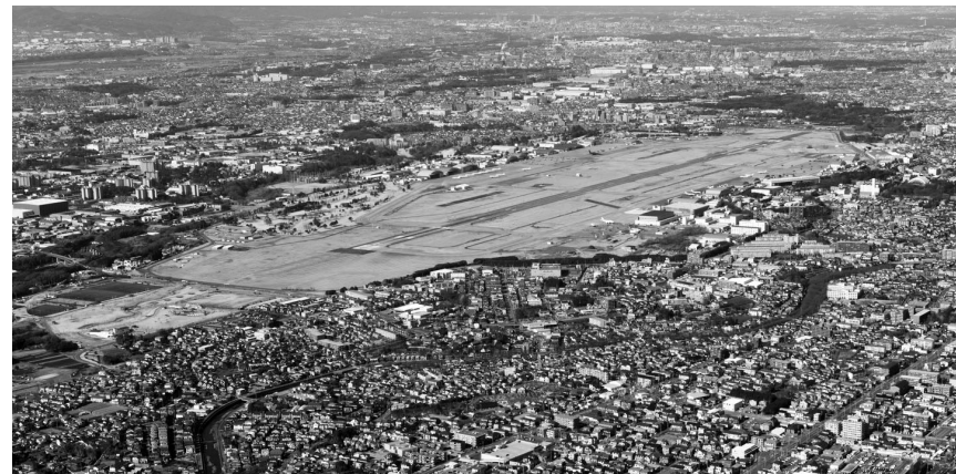
大和市の南西部に所在する広大な厚木基地

厚木基地は、県内で2番目に人口密度が高い大和市の南西部に所在し、市民生活に大きな影響を及ぼしています。今号では、厚木基地に起因する諸課題と、その解決に向けた市の取り組みについてお伝えします。