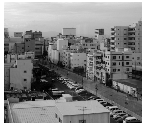
建物等の高さ制限が課されている大和駅周辺

また、近隣市の駅周辺では、高層マンションなどが建設されていますが、大和市では、厚木基地が航空基地であることにより、地域の大半に航空法による建物などの高さ制限が課されるため、街づくりの支障となっています。