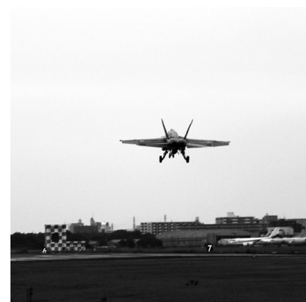
厚木基地でのFCLPの様子(平成29年9月)

されました。在日米軍再編に伴い、平成30年3月までに、すべての空母艦載機(固定翼機)部隊が山口県の岩国基地に移駐しましたが、その後の硫黄島での同訓練実施の際にも厚木基地が予備施設の一つに指定されており、今後も厚木基地で同訓練が実施される可能性があります。