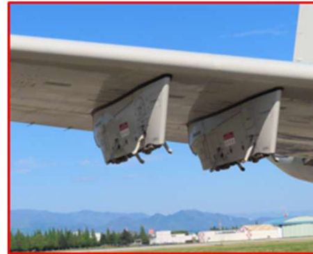
ウィングランチャー