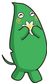
大和市イベントキャラクターヤマトン

※この調査票は、住民基本台帳を基に、就学前児童（0～5歳）のいる世帯の中から3,000世帯を抽出し、お送りしています。対象者は無作為で抽出していることから、誠に申し訳ありませんが、重複して市の実施する他の調査票が送付される場合がございます。なお、抽出は令和5年10月24日現在の状況によるものです。