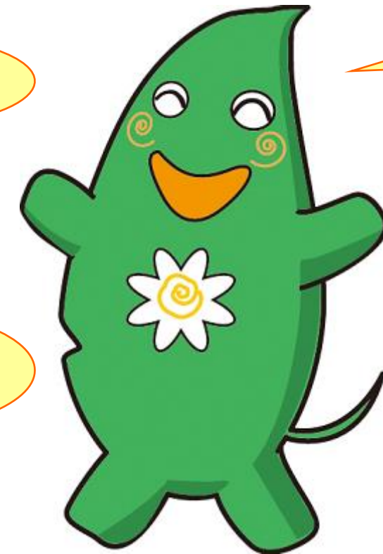
大和市イベントキャラクター ヤマトン