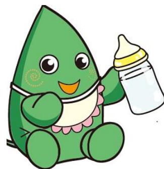
大和市イベントキャラクター ヤマトン

サービスとは、児童発達支援（未就学児対象）、放課後等デイサービス（就学児（小学1年～）対象）、保育所等訪問支援などを指します。日常生活の基本的動作の習得や集団生活の適応力をつける事や人とのコミュニケーション力をつける事など、お子さんの発達に合わせながら自立した日常生活が送れるよう支援を受けます。