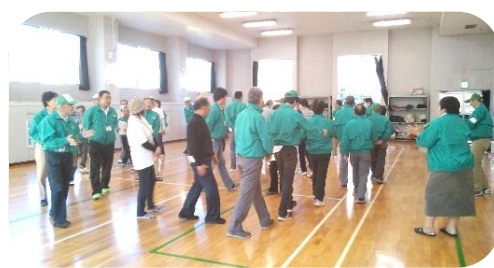
レクリエーションゲームの体験学習