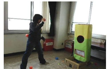
「ランドわくドキ」の魚つりとストラックアウト