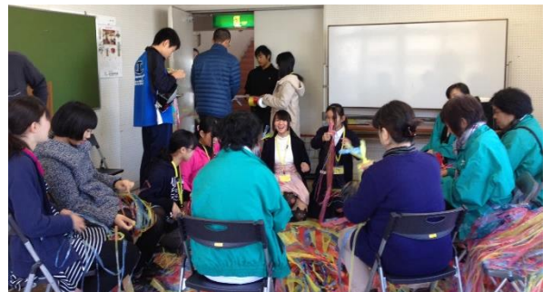
準備は和気あいあいでもっとも楽しいよ

とき 12月6日(日) 10時~14時 場所 青少年センター 催し物 ステージ発表・お化け屋敷・模擬店など 来場者 1,162名 青少年指導員団体育成部会サポートのお化け屋敷とゲームコーナーには行列ができるほど大勢の子どもたちが参加し、楽しんでいました。