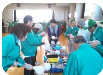
バルーンアートの制作風景

こんな終始笑顔が絶えない雰囲気の一泊研修でした。その後、早速地区のクリスマス会で実践されているのを見た仲間から「大反響でした」という、うれしい報告が寄せられています。