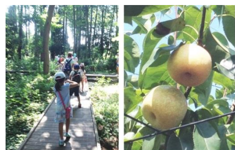
宇都宮記念公園と大和市産の梨