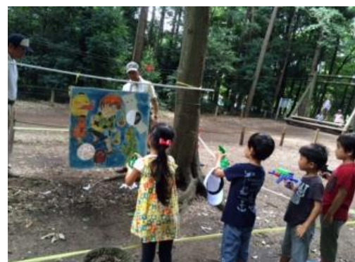
水鉄砲的当てゲームの様子

この行事には中学生、高校生ボランティアも参加して、小学生以下の子どもの面倒も見ています。参加者全員がこのような体験の中で、互いに敬愛精神や友情を、感じてもらえたらと願っています。