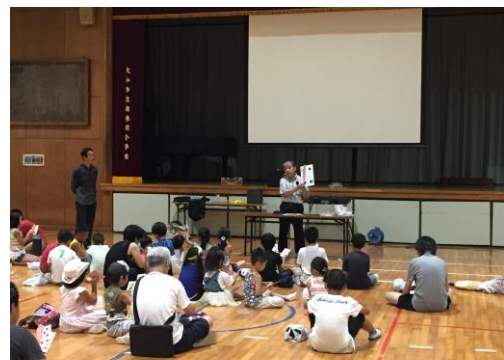
今年のお楽しみ会は手品を楽しみました

映画の後はお楽しみ会。今年は手品サークルの方に来ていただいて、子どもたち参加型の手品を披露していただきました。南林間地区の子どもたち！夏休みは親子映画会にぜひ遊びに来てください！