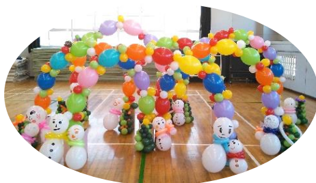
バルーンアート 完成！