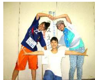
8 km コース 優勝チーム