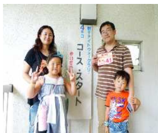
4 km コース 優勝チーム