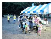
4 km コースより