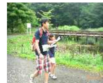
6 km コースより