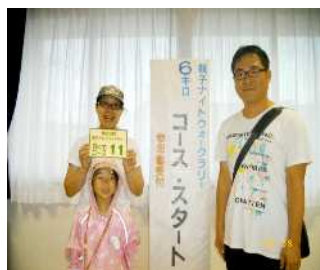
6 km コース 優勝チーム