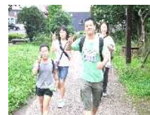
8 km コースより