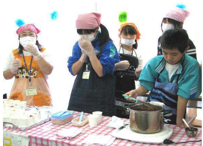
チョコバナナ作り: 声を出して販売するのが楽しかった