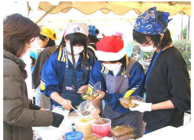
やきそば模擬店: お客さんがやさしかった