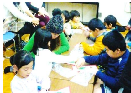
クリスマスカード作り