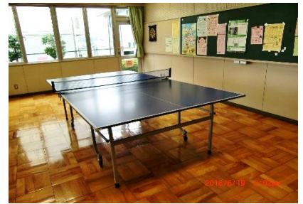
卓球にもチャレンジしよう

大和市の各地域には児童館があり、子どもたちが楽しく、安心して遊べる様に、本や玩具がたくさんおいてあります。管理指導員さんが楽しいゲームやイベントをたくさん考えて待っていますので、だれでも自由に、ひとりで来ても安心して遊べます。昨年は大和市の全児童館で約130,000名のお友達が遊びに来てくれました。今年も皆さんを待っていますよ。