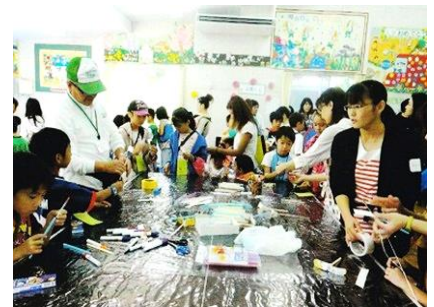
作って遊べる紙トンボ工作

◆利用時間：火～金曜日・日曜日は12時～17時30分 土曜日は10時30分～17時30分 月曜日はお休みです。