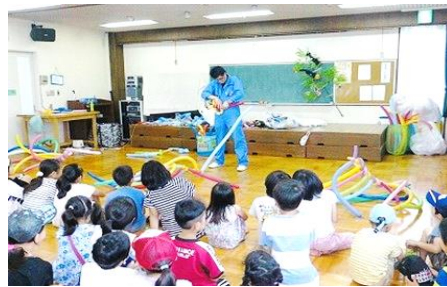
七夕のつどいイベント