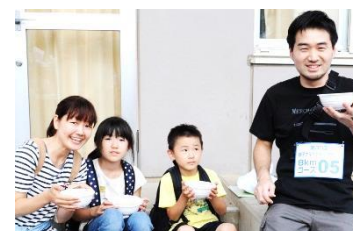
★豚汁無料サービス

7月16日(土、晴れ)親子ナイトウォークラリーが行われました。3コース(4Km/7Km/8Km)から1コースを選んで家族や友人たちでチームを作り、151組、526名の方が参加しました。コマ地図を頼りにチームで協力し合い、ゴールを目指しナイトウォークラリーを楽しみました。