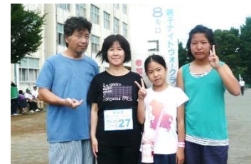
★ユーモアチーム名賞(8Km)