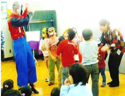
お楽しみ会パフォーマンス

10月・ハロウィンパーティー・ハロウィン工作 11月・ふれあい広場（出張児童館）・作って遊べる工作 12月・クリスマスパーティー・クリスマス工作 1月・お楽しみ会・干支の工作