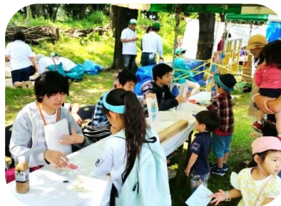
キャラクター当て