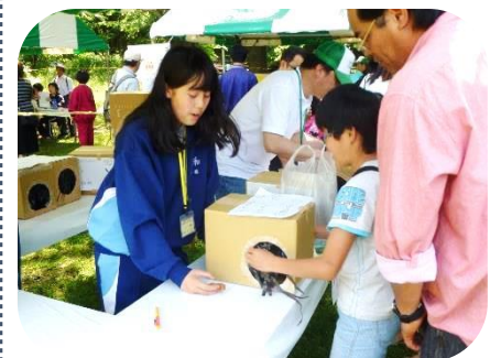
ミステリーボックス