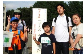
★ユーモアチーム名賞(7Km)