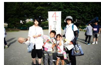
★ユーモアチーム名賞(4Km)