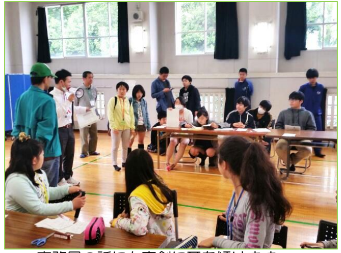
事務局の話にも真剣に耳を傾けます。