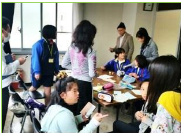
「総合受付」 2,000 枚の受付カードを作成しました。