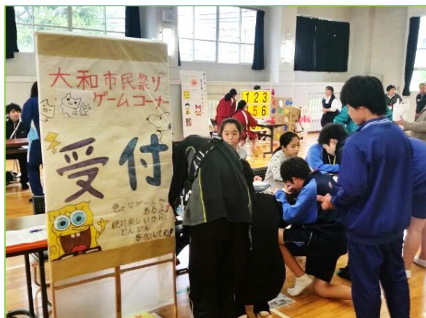
「総合受付」担当 受付しま～す。並んで並んで！

各コーナーを実際にシミュレーションし、問題点を洗い出しました。 皆さん、楽しみながら真剣に取り組んでいますね。