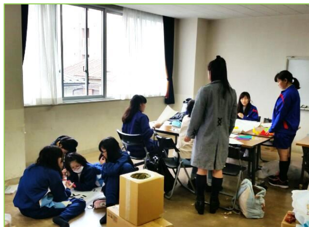
「ミステリーボックス」担当 プラカードなどの制作風景。