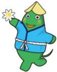
大和市イベントキャラクター ヤマトン