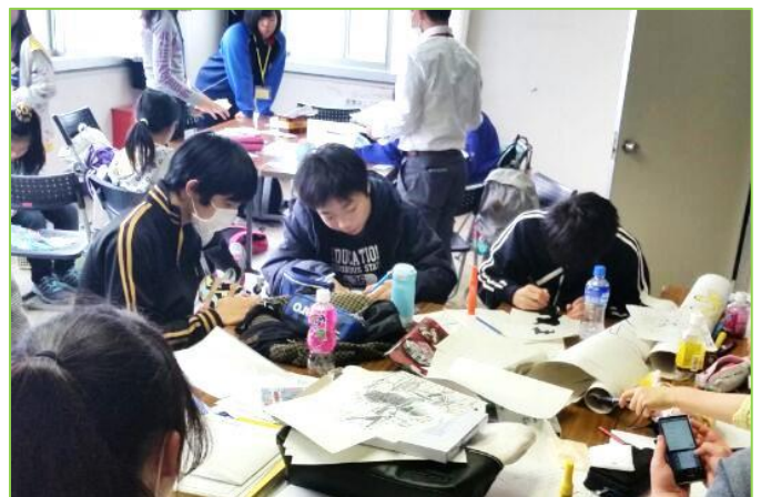
「キャラクター当て」担当の高校生ボランティア 1 枚ずつ丁寧に手描きでキャラクターを描きます！