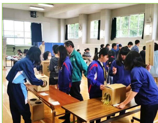
「ミステリーボックス」担当 えーっ、中に何がはっているの。