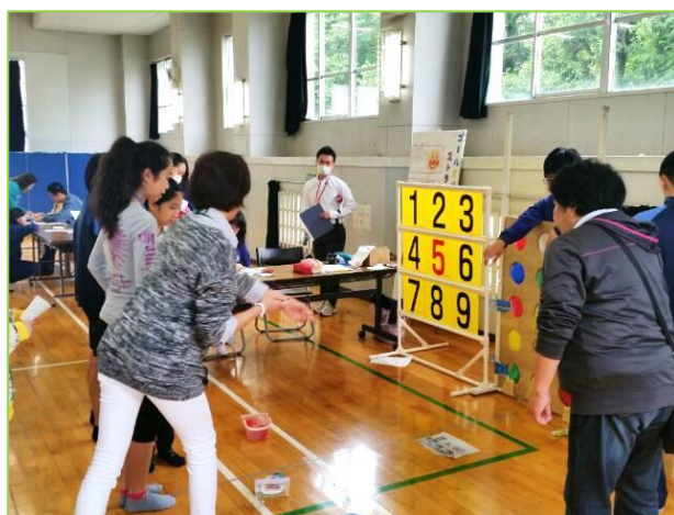
「ストラックアウト」担当 うまく当たるかな。