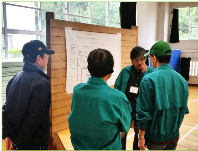
レイアウトについて話し合う青少年指導員