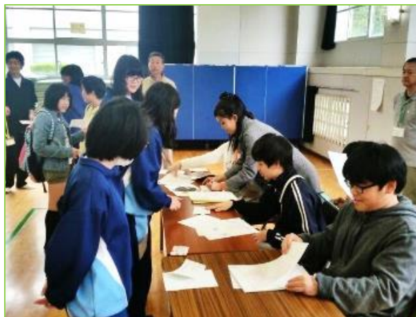
「キャラクター当て」担当 このイラスト、上手だね。