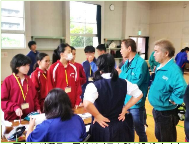
青少年指導員のアドバイスも熱が入ります！