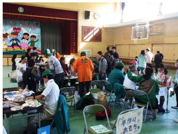
飛ぶものを作って遊ぼう!