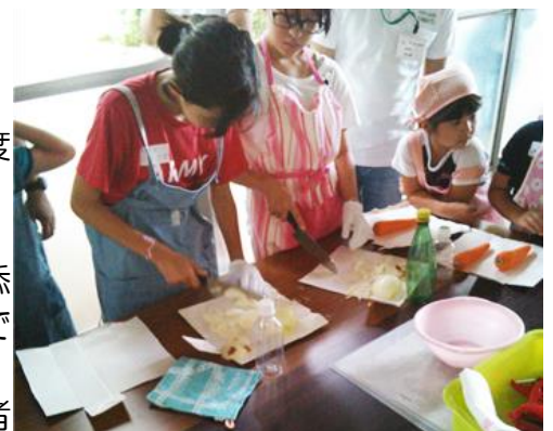
カレーとナン作りの様子

食材手配や、煮たり焼いたりなどの私たちの仕事は、参加者の和やかな笑顔に報われます。今回も大鍋で煮込んだカレー、焼きたてナンが美味しく出来上がって、大盛況となりました。