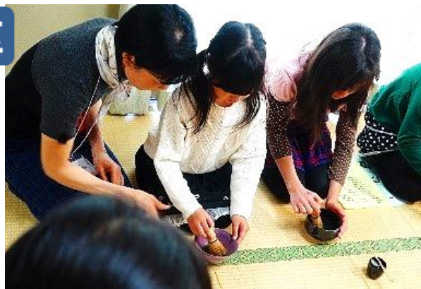
茶道を体験している様子