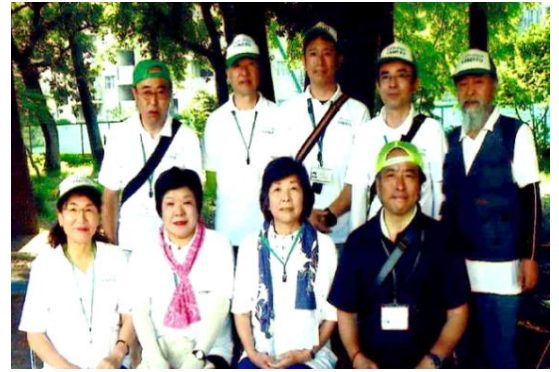
楽しく活動する陽気な仲間たち

「ふれあい広場」では竹馬・ヨーヨー・おりがみ・缶釣り・ハリガネ工作など、習得した技術を駆使し、子どもたちと直にふれあい、活動しています。