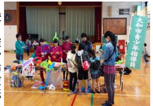
ふれあい広場の様子

10月に文ヶ岡小学校区の体育館をお借りして、ふれあい広場を開催しました。中学生ボランティアや小学校の先生方にお手伝いをしていただき、バルーンアート・紙ジャイロ飛行機を子どもたちと楽しく制作。紙ジャイロ飛行機は紙とセロテープでできるため、小さい子どもでも簡単に制作でき、実際に飛行機を飛ばすときは、子どもたちが手こずっている様子が見られました。