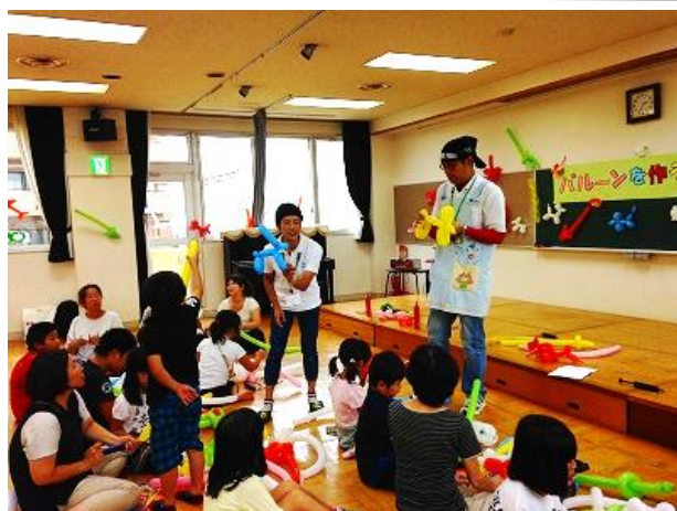
わいわい遊ぼう会の様子