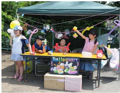
バルーンアート店