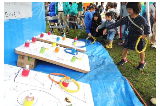
大和市イベントキャラクターヤマトン