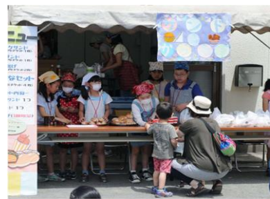
サンド&から揚げ店