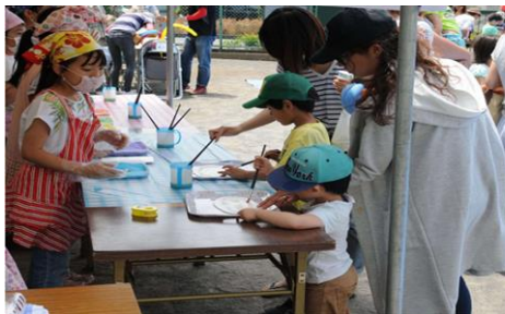
おえかきせんべい店