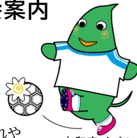
大和市イベントキャラクター ヤマトン

なお、申請時点で過去の育成料に未納がある場合は、納付確認後に入会審査を行います。