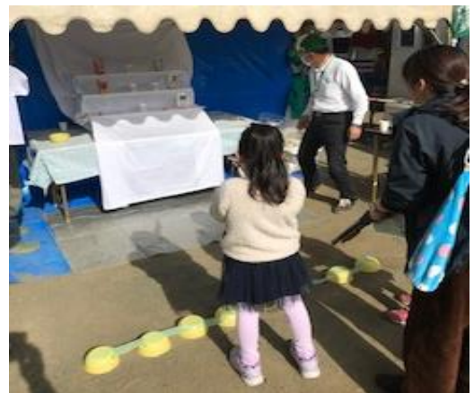
大きい的でも意外と難しい！

好天に恵まれ多くの来場者が訪れる中、上草柳地区からの応援をもらい、本部・竹馬・射的担当に分かれ、それぞれに子どもたちと楽しいひと時を過ごしました。