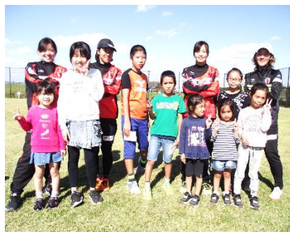
獅子とひょっとこもいたよ!