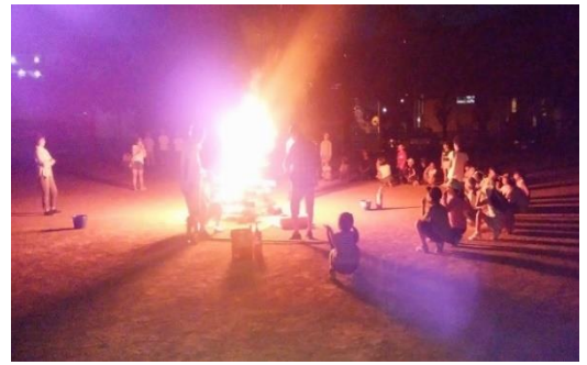
燃え上がる炎を囲んで

毎月開催している「わくわくっ子クラブ」のうち、8月は柳橋小学校で恒例の「夏のキャンプ」を行いました。かまどから手作りして飯ごう炊さん。みんなで作ったおいしい夕食を食べた後は、お待ちかねのキャンプファイヤー。火の神が登場して点火を行い、ファイヤーの幕開けです。炎を囲んで歌やゲームで楽しい1日を終えました。