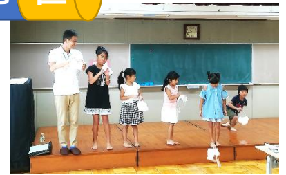
出来たよ“らっかさん”

と協力してクリスマス会を実施します。青少年指導員の1人がサンタさんに変装して、簡単なゲームをして楽しみました。