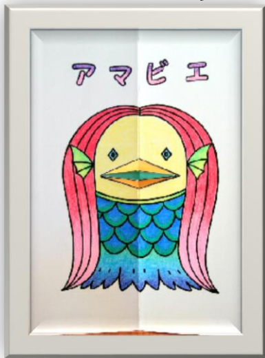
アマビエの塗り絵