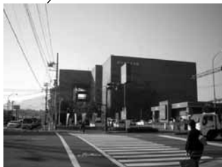
厚木市文化会館 本厚木駅下車徒歩 13 分 2 ホール (1412 席、376 席)