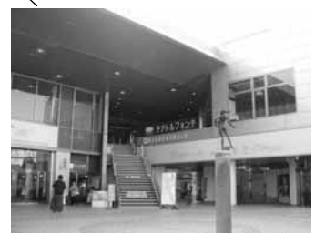
テアトルフォンテ いずみ中央駅下車徒歩 1 分 (386 席)