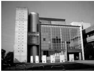
海老名市文化会館 海老名駅下車徒歩 5 分 大ホール 1100 席 (上) 小ホール 335 席 (下)