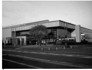
ハーモニーホール座間 相武台前駅下車徒歩 15 分 2 ホール (1310 席、410 席)