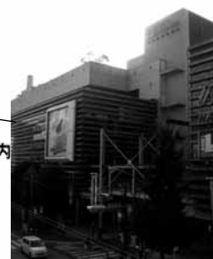
フィリアホール 青葉台駅下車徒歩 3 分 (500 席)