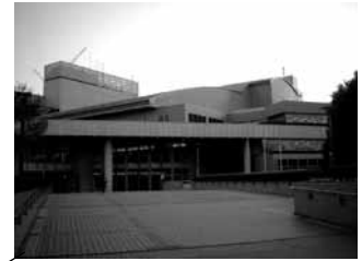
グリーンホール相模大野 相模大野駅下車徒歩 4 分 2 ホール (1790 席、240 席)