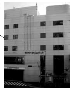
サンハート 二俣川駅下車徒歩 2 分 2 ホール (300 席、103 席)