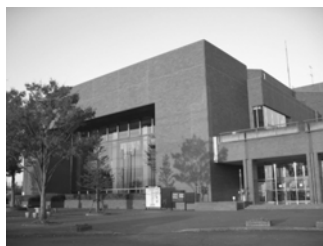
綾瀬市文化会館 海老名駅下車バス約 20 分 2 ホール (1300 席、330 席)