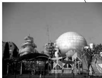
湘南台文化センター 湘南台駅下車徒歩 5 分 (600 席)