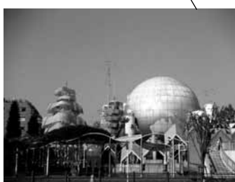
湘南台文化センター 湘南台駅下車徒歩 5 分 (600 席)