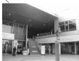
テアトルフォンテ いずみ中央駅下車徒歩 1 分 (386 席)