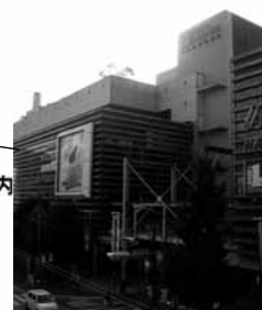
フィリアホール 青葉台駅下車徒歩 3 分 (500 席)