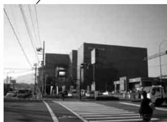
厚木市文化会館 本厚木駅下車徒歩 13 分 2 ホール (1412 席、376 席)