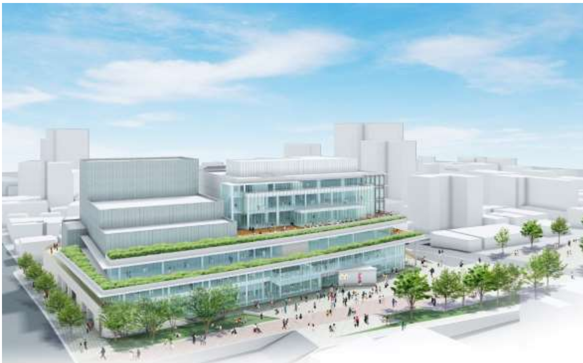
文化創造拠点完成予想図

大和駅東側第4地区第一種市街地再開発事業は、平成28年7月を竣工予定としていることから、竣工後3ヶ月の移転期間を経た、平成28年11月3日(木)[文化の日]を条例の施行日(開館日)とします。(「文化創造拠点に係る指定管理者の指定等に関する条例」の指定管理者の選定手続きに関する部分は除きます)