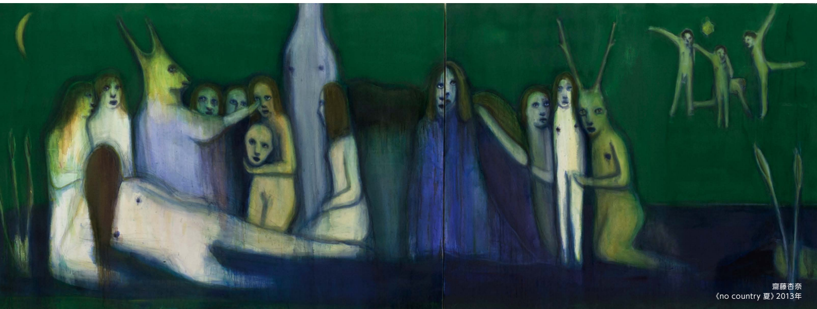
齋藤杏奈 《no country 夏》2013年