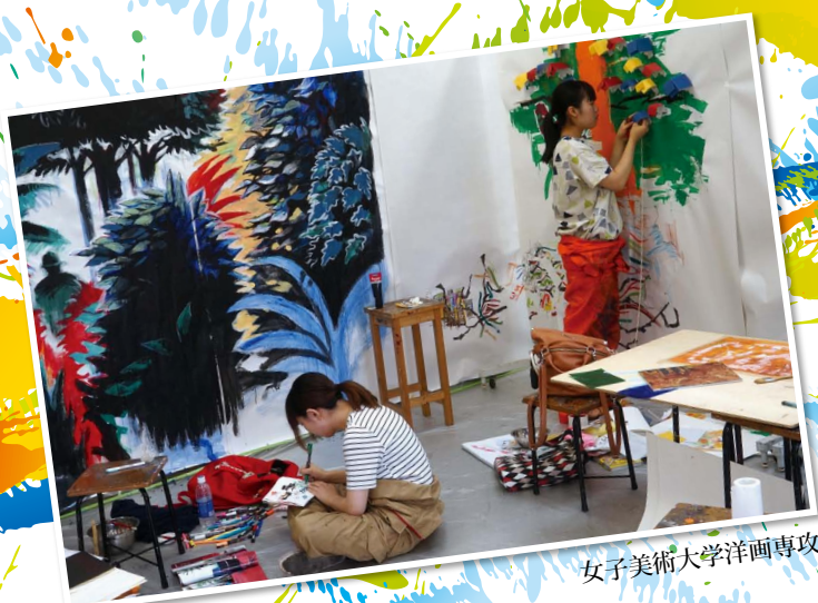
女子美術大学洋画専攻

作品との「おしゃべり」を通して、同時代を生きる作家たちの魅力あふれる表現をお楽しみください。