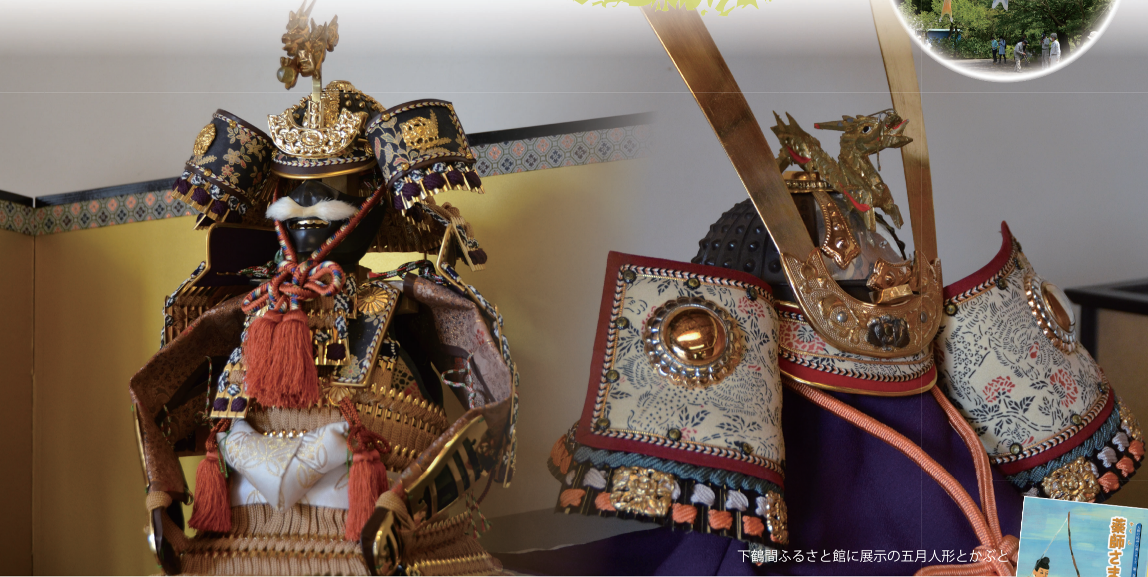
下鶴間ふるさと館に展示の五月人形とかぶと