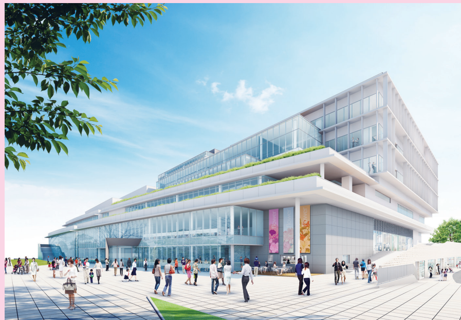
プロムナード側から見た外観イメージ