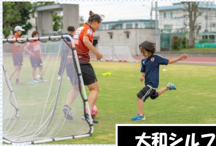
大和シルフィードとサッカー体験

当日は曇り空で外の運動には最適な気候でした。今年も芝生開放感謝DAYが同時開催されました。