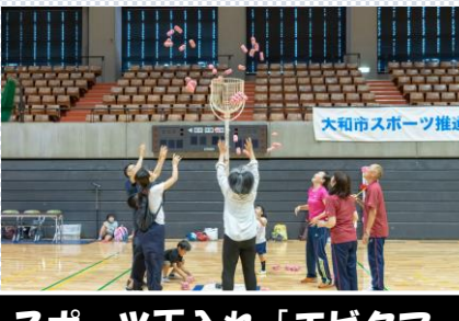
スポーツ玉入れ「エビタマ」