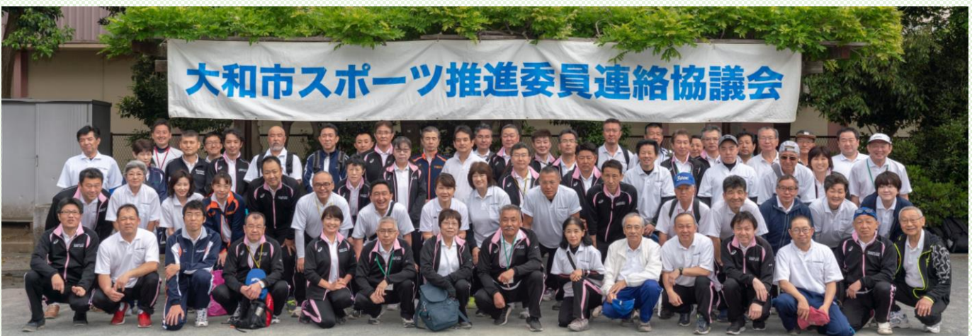
大和市スポーツ推進委員連絡協議会