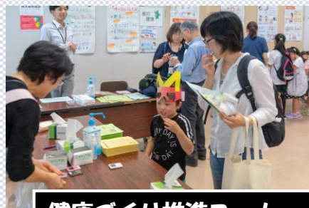
健康づくり推進コーナー