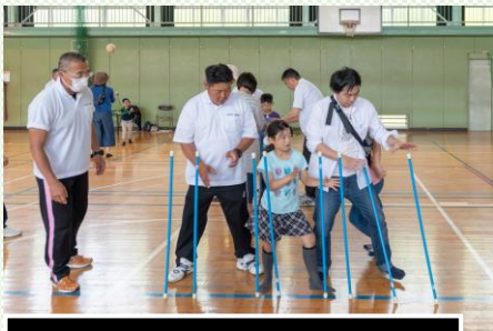
キャッチング・ザ・スティック