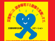
このステッカーが目印