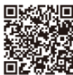
市ウェブサイトの災害関連情報

事前にテレビやインターネット等の気象情報にご注意ください。市は次のような方法で情報を提供します。