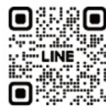
大和市LINE公式アカウント