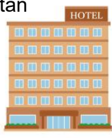
Cơ sở lưu trú