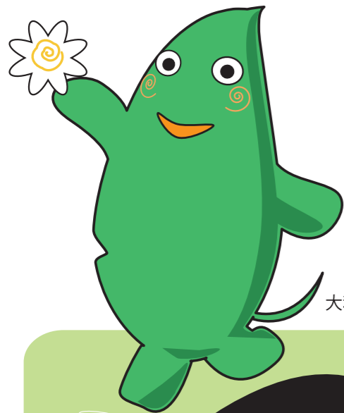
大和市イベントキャラクター「ヤマトン」