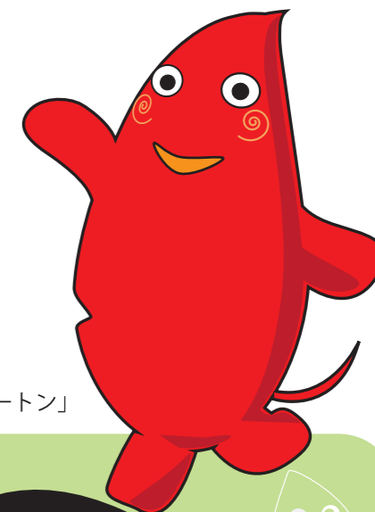
ヤマトンのお友達「ハートン」