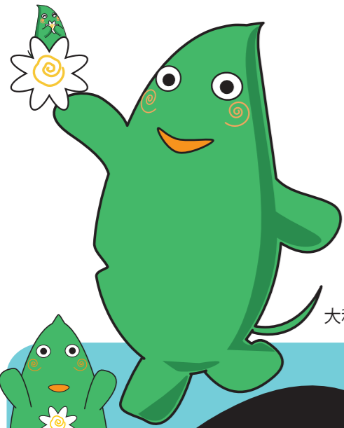
大和市イベントキャラクター「ヤマトン」