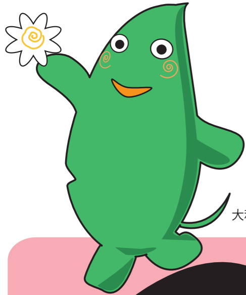
大和市イベントキャラクター「ヤマトン」