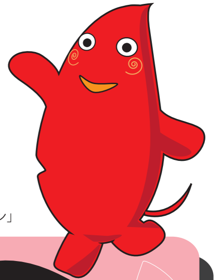
ヤマトンのお友達「ハートン」