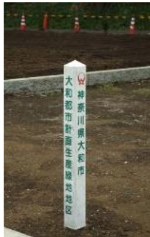
▲生産緑地地区に設置された標識

市街化区域内において緑地機能等が優れた農地等を計画的に保全し、良好な都市環境の形成に資することを目的として都市計画に定めるものです。