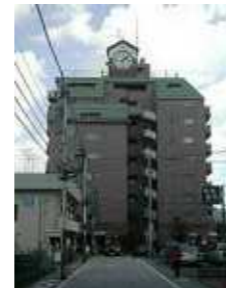
通りのシンボル「時計台」と森の宿「ふくろう」