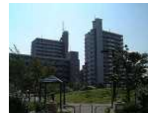
コンフォール鶴間ライラック通りとリラの丘公園