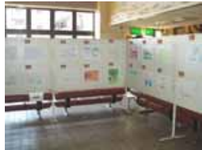
「やまと夢風景」絵画展示