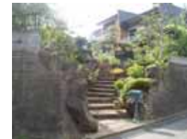
山下邸 「階段状のアプローチ」(福田)