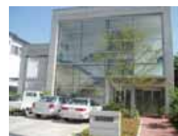
アムールホール・大長産業 株式会社(深見西)