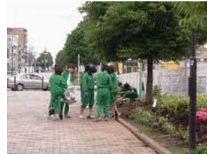
「大和駅前、未来きれい大作戦」(地域はみんなの庭) ～中学生ボランティアを中心とするまち緑化・美化活動～ (大和東)