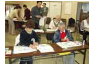
色見本を使用した実習(専修)