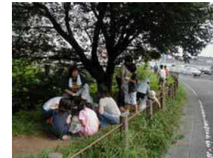
「新道下ふれあい緑地」<引地川河川敷> 開設・維持保全活動(福田)