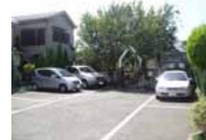
小泉歯科医院 「駐車場からのアプローチ」(福田)