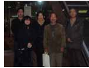
他市イベントへ参加(横須賀市)