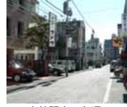
<南林間南一条通り>