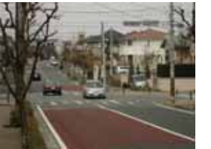
<つきみ野駅前通り>