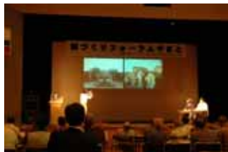
やまと景観教室(寸劇)