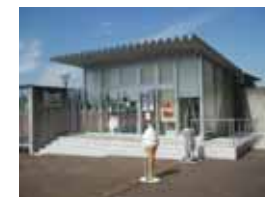
カフェテリアみなみ風 大和スポーツセンター(上草柳)