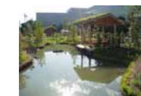
三機自然環境園(ピオトープ) 三機工業株式会社大和事業所 (下鶴間)

【編集】大和市 都市部 都市整備課 街づくり推進担当 TEL:046-260-5483 FAX:046-264-6105 E-mail:t-seibi@city.yamato.lg.jp URL:http://www.city.yamato.lg.jp/t-seibi/index.htm