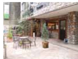
ベルベ(大和)駅前店 (大和東)