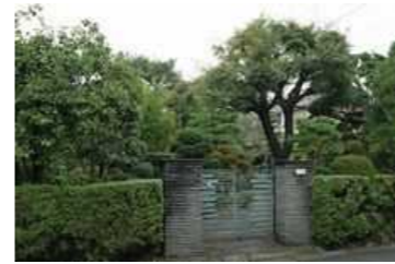
富塚邸「古き中央林間の面影を残す庭」