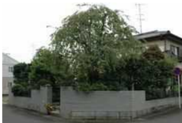
森永邸「枝垂れ桜と緑豊かな庭」