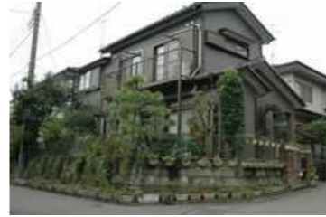
針邸「壁面緑化とプランターによる外周部の演出」