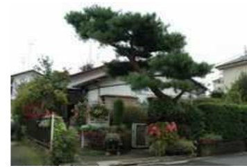
川崎邸「開放的な前庭と立体的花壇」(中央林間)