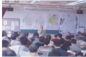
内山の街づくりを考える会