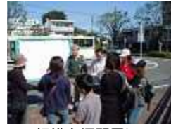
<相模大塚駅周辺アクセスチェック>