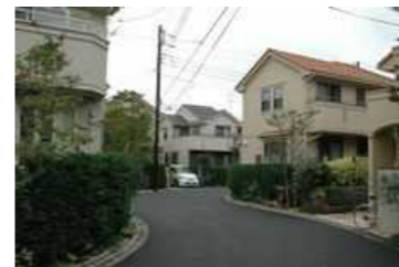
「ブラウドシーズン中央林間」

【編集】大和市 都市部 都市整備課 街づくり推進担当 TEL:046-260-5483 FAX:046-264-6105 E-mail:t-seibi@city.yamato.lg.jp URL:http://www.city.yamato.lg.jp/web/t-seibi/