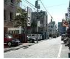
<南林間南一条通り>