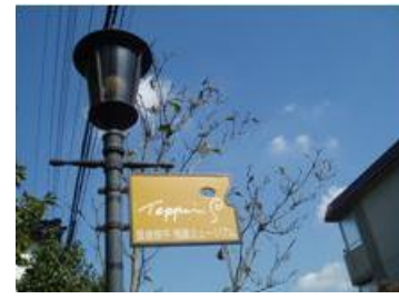
笹倉鉄平版画ミュージアム(上和田)