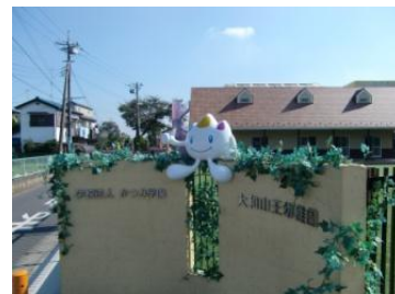
大和山王幼稚園「サンちゃん」(下鶴間)