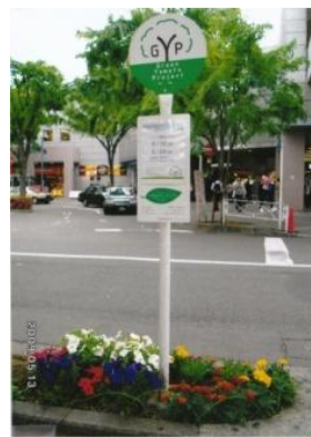
Green Yamato Project (中央林間)