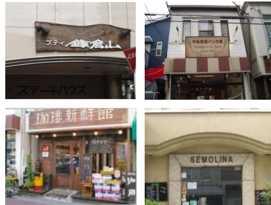
中央林間5丁目界限(中央林間) <ブティ鎌倉山・中央林間パンの家・珈琲新鮮館・セモリナ>