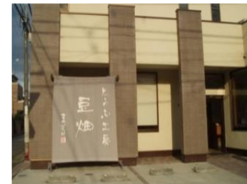
とうふ工房「豆畑」(西鶴間)