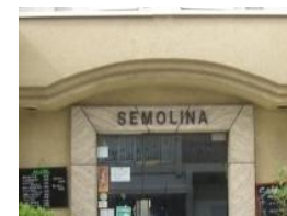
中央林間5丁目界限(中央林間) <プチ鎌倉山・中央林間パンの家・珈琲新鮮館・セモリナ>