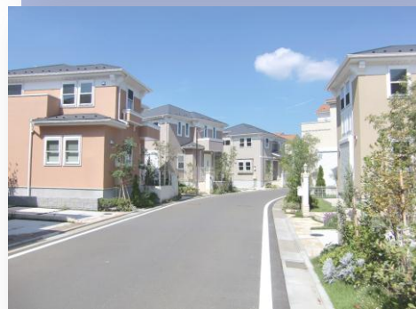
▲下鶴間山谷北土地区画整理事業(下鶴間)