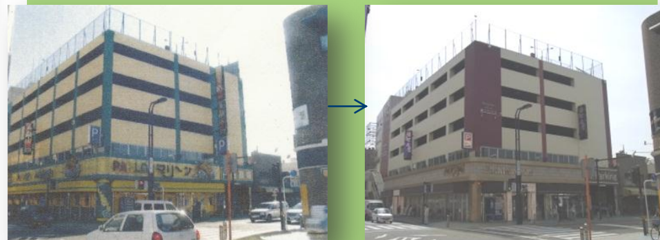
▲改修時に屋外広告物条例と景観計画・景観条例に基づき指導を行った例

大和らしい魅力ある景観を創造していくため、景観法に基づいた大和市景観計画と大和市景観条例を定め、平成20年10月から運用しています。