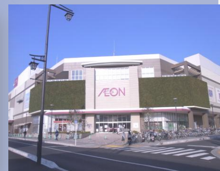
▲イオン大和ショッピングセンター(渋谷(南部地区)土地区画整理事業地区内)