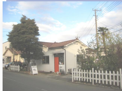
▲FLAT HOUSE cafe(中央林間)