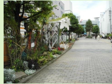
大和駅東側プロムナード ガーデニングプロジェクト