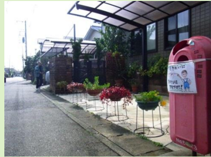
南林間西南自治会 クリーンキャンペーン