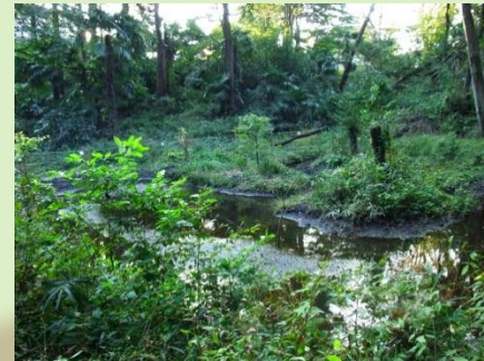
上和田野鳥の森ビオトープ