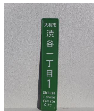
渋谷北部地区実施時に電柱等に設置した表示板