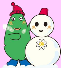
大和市イベントキャラクター 「ヤマトン」